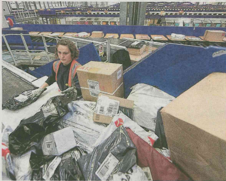
Le site de Carvin emploie plus de 200 agents et a recours en période de fin d'année à une centaine d'intérimaires.

DOUVRIN - CARVIN. Les 220 salariés de la Plate-forme colis de Carvin, l'une des plus grandes de France où transitent en période de pointe 300 000 paquets par jour, en savent davantage sur leur avenir à moyen terme. D'après nos informations, les bruits d'un possible transfert qui circulaient depuis plusieurs mois se sont confirmés mardi à l'issue d'une réunion plénière à la direction opérationnelle territoriale colis Nord-Est.