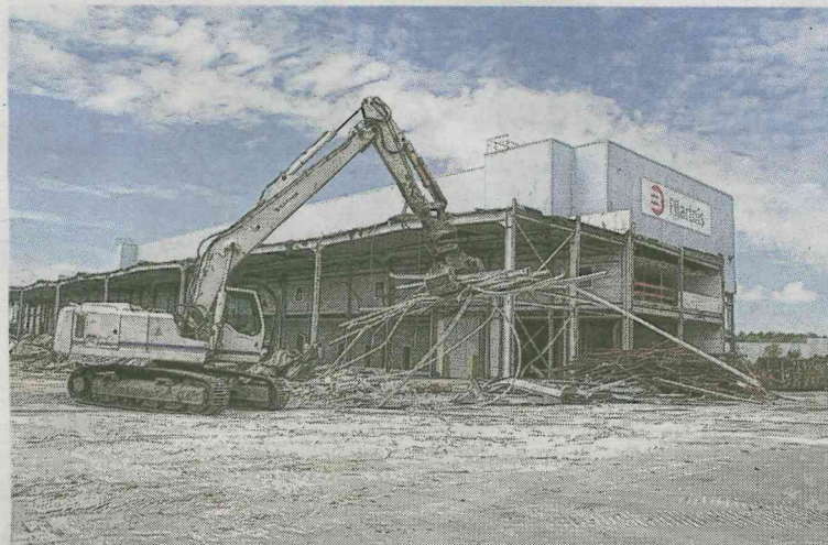
La friche Filar-tois, en cours de démolition, tient la corde pour accueillir un bâtiment moderne d'une surface de 30 000 m 2 .

Contactée vendredi, la direction régionale de la Poste n'a pas été en mesure de nous répondre dans l'immédiat.