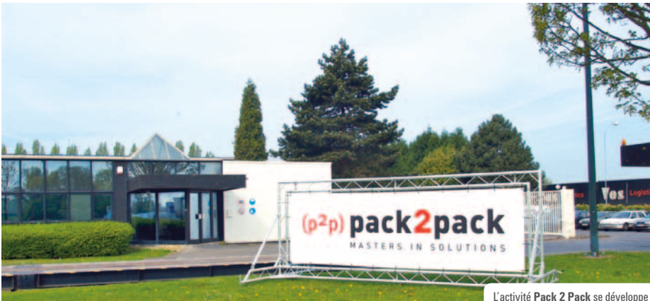
L'activité Pack 2 Pack se développe