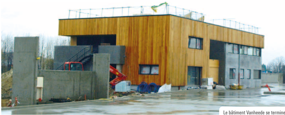
Le bâtiment Vanheede se termine