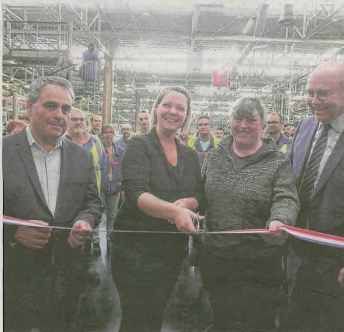
Le ruban inaugural de la ligne de production du nouveau moteur diesel DV-R de PSA a été coupé, jeudi par des salariées.