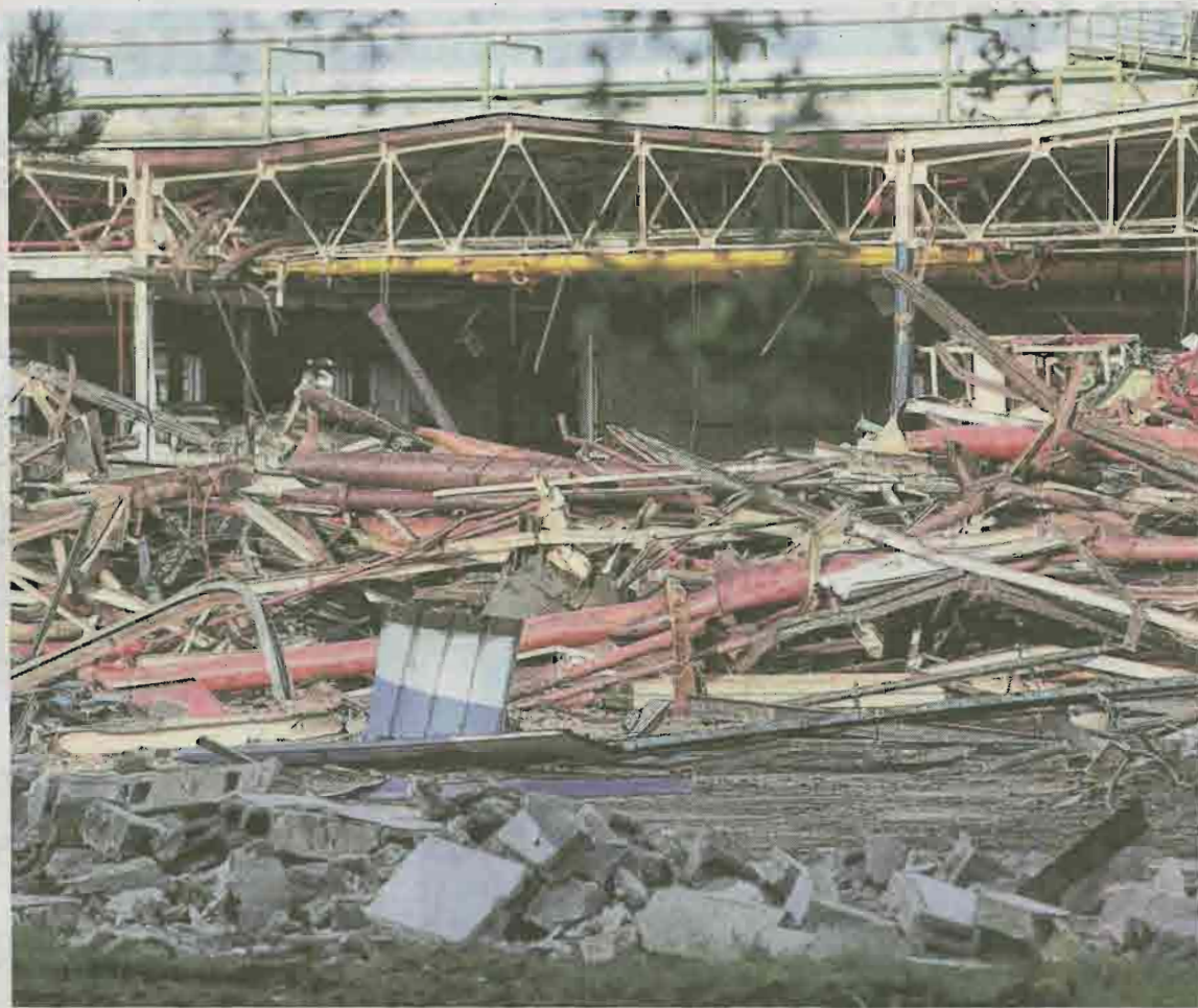
Quand on arrive à la Française de mécanique, le regard est forcément attiré par les démolitions qui préfigurent le nouveau visage de l'usine douvrinoise.