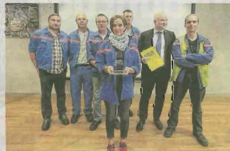
Pour la troisième année consécutive, le bloc essence 3 cylindres EB a été élu moteur de l'année.

son optimisme sur l'avenir du site de la FM. « 5 M€ ont été investis ici. Croyez-vous vraiment qu'un groupe qui envisage de partir aurait mis autant d'argent ? » ■