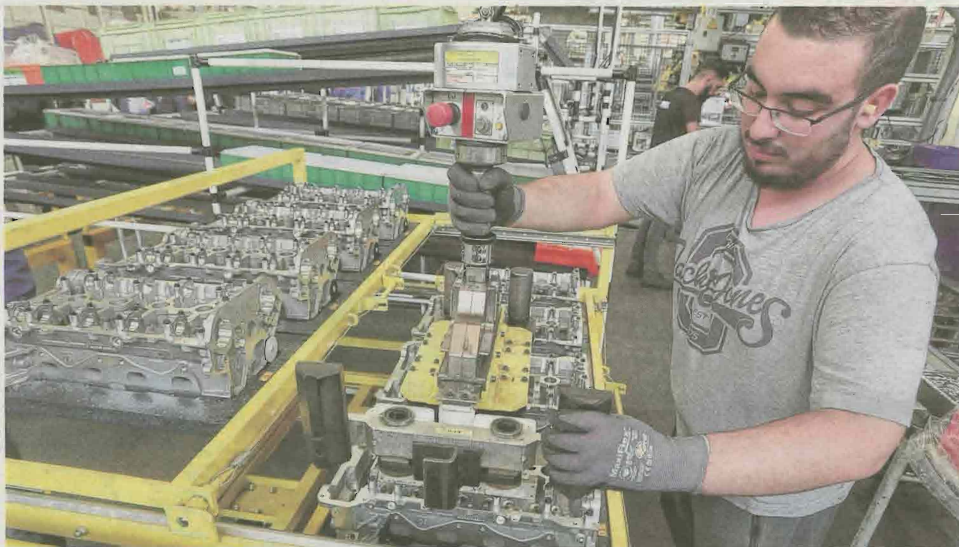
La montée en puissance de la production du moteur DV-R va être brutale passant de 80 unités à 2000 par jour en quelques mois.