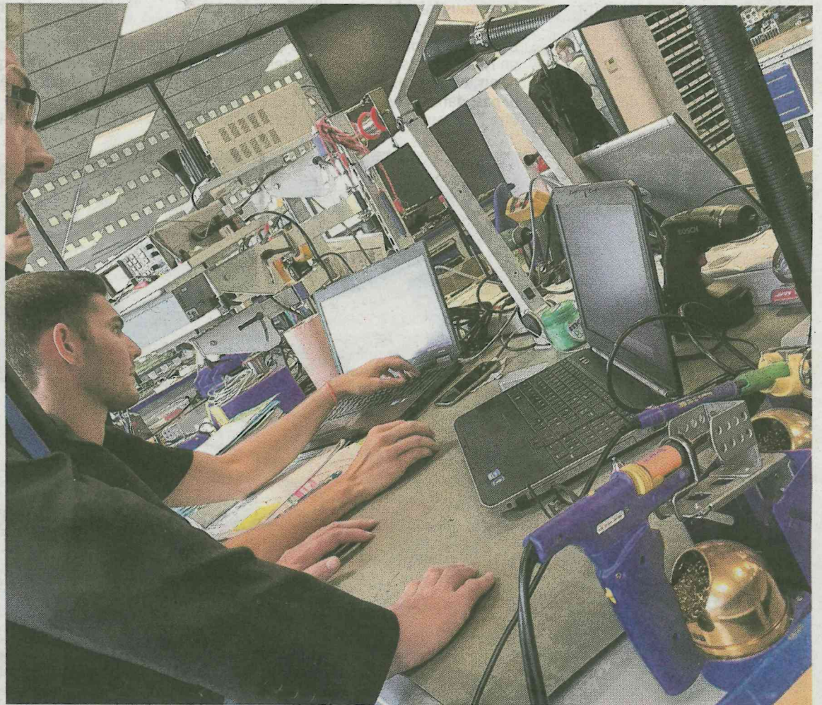
Dans ses nouveaux bureaux ultramodernes, le groupe DV répare les process industriels de ses clients.

Devos-Vandenhove se démarque aussi par sa politique de ressources humaines résolument tournée vers la jeunesse. Les DV Days qui se sont déroulés durant la semaine ont été l'occasion d'accueillir des centaines de lycéens, d'étudiants et de leur montrer ce qu'est aujourd'hui le métier. La société valorise aussi les stagiaires et les alternants. Une bonne trentaine sont accueillis chaque année et constituent le vivier de recrutement. ■