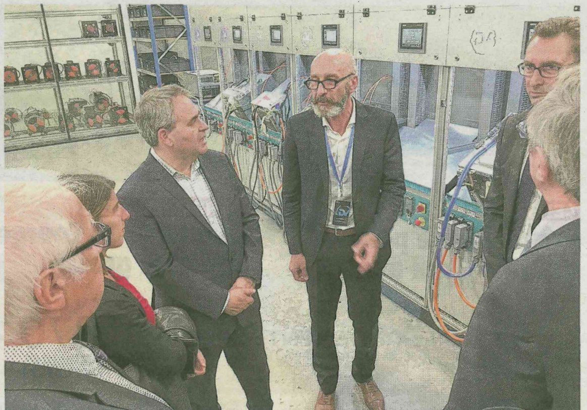
Avec d'être remis au client, chaque élément réparé est testé en laboratoire.

grands domaines d'activité : maintenance électromécanique, maintenance électronique, maintenance prédictive, électricité-automatisme, négoce.