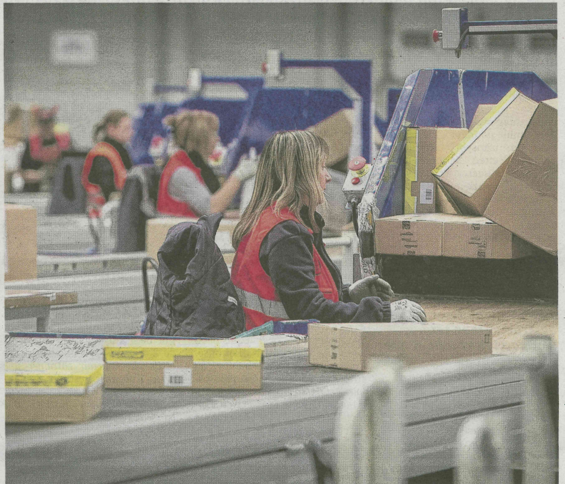
En arrivant à Douvrin, la Poste va augmenter sa capacité de traitement des colis.