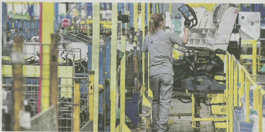
55 salariés seront embauchés en CDI cette année. Il s'agit majoritairement d'intérimaires.