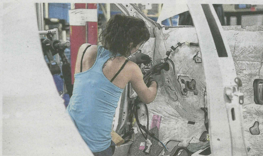
L'industrie va mieux. La croissance est au rendez-vous avec une hausse de l'activité de 1,6 % sur l'année.

Les transports, une belle tenue. Le bâtiment, des carnets de commandes et des volumes retrouvés même si les prix ne suivent pas toujours (des affaires sont encore conclues à perte). L'industrie,