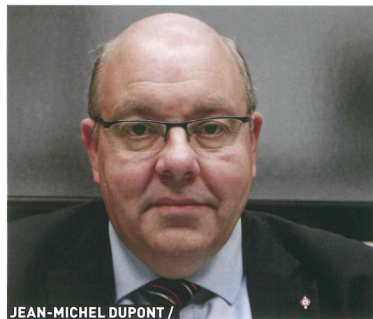
JEAN-MICHEL DUPONT / Maire de Douvrin