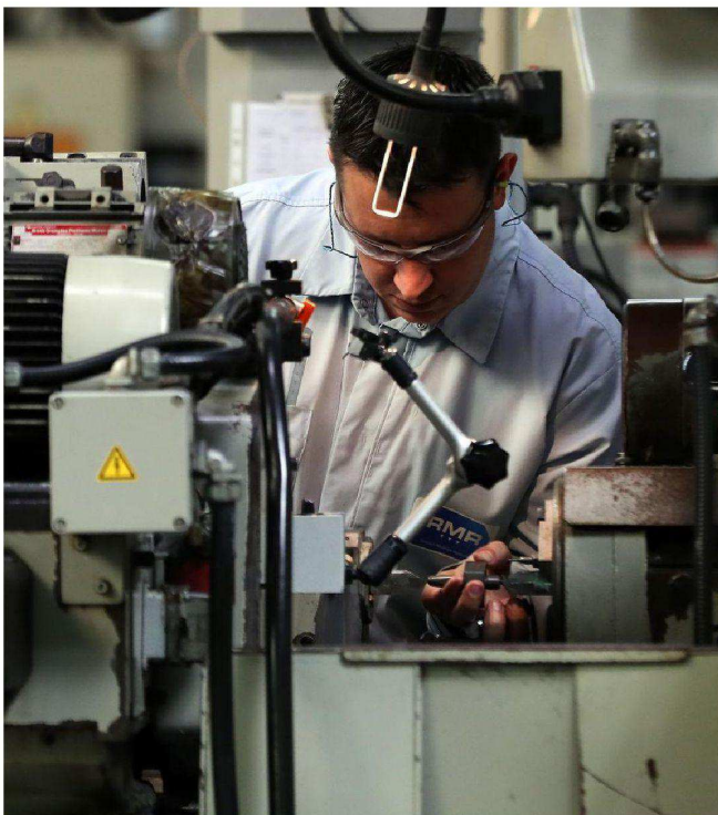
Chez RMR Industries, une série peut compter seulement dix pièces.