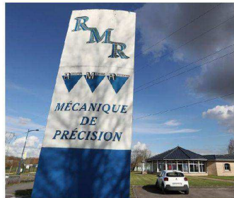
Basée au parc des industries Artois Flandres, RMR Industries va fêter ses cinquante ans cette année.

+ SUR NOTRE SITE PLEIN LES YEUX Retrouvez toutes nos photos prises chez RMR Industries sur lavoixdunord.fr , onglet « Béthune - Bruay ».