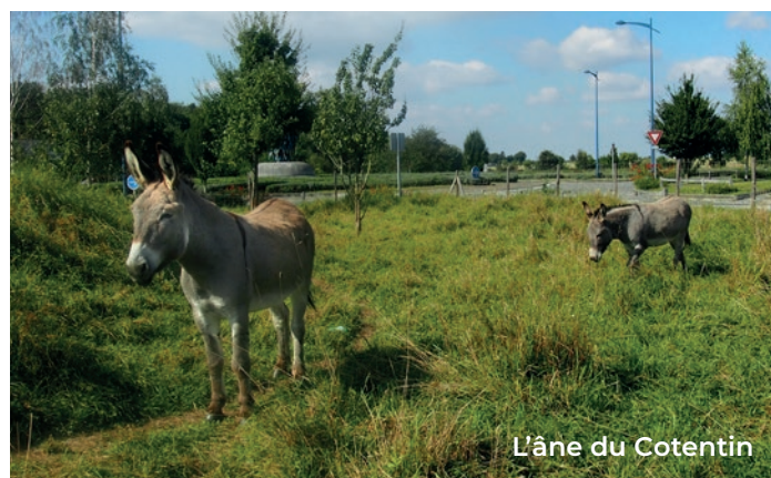
L'âne du Cotentin