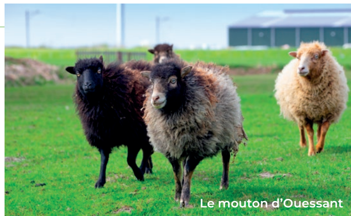
Le mouton d'Ouessant

En savoir plus sur Patureco : https://www.patureco.fr/