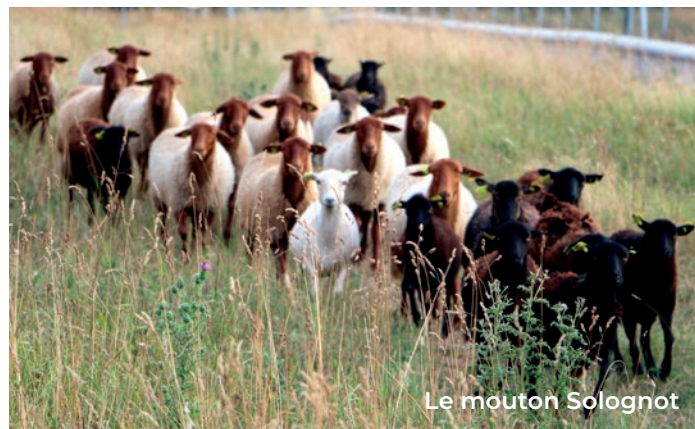
Le mouton Solognot