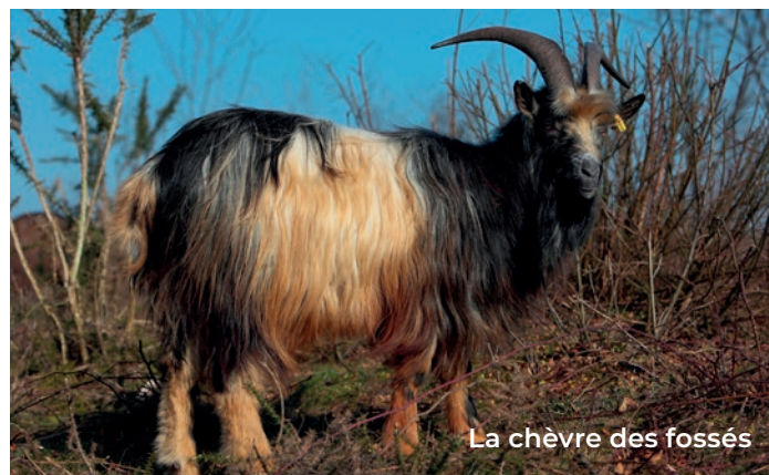
La chèvre des fossés